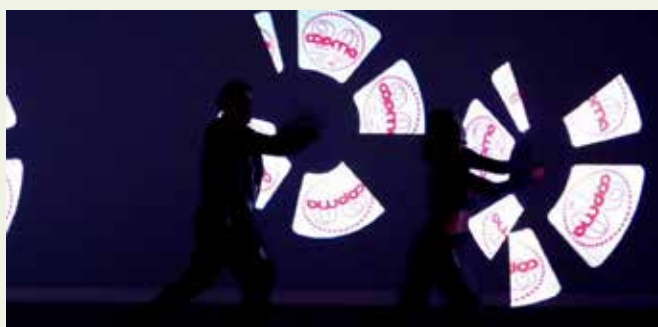
IL LOGO DEI 20 ANNI