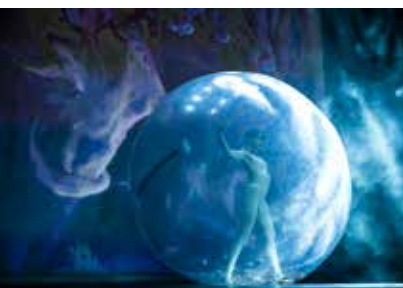
ESIBIZIONE SPHERE SHOW