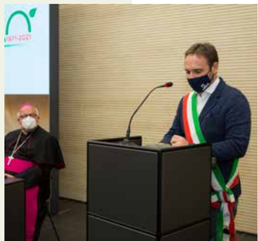
L'ASSESSORE MATTEO FORNASINI DEL COMUNE DI FERRARA