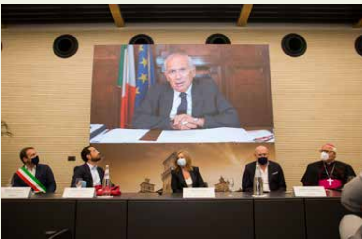
IL MINISTRO PATRIZIO BIANCHI