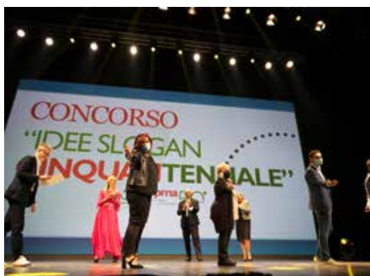
LA PREMIAZIONE DEL CONCORSO SLOGAN