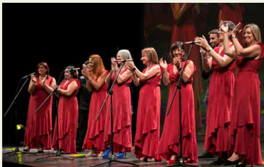
GRAN FINALE CON IL CORO COPMA