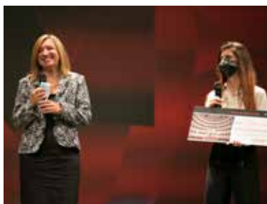
PREMIO TESI DI LAUREA