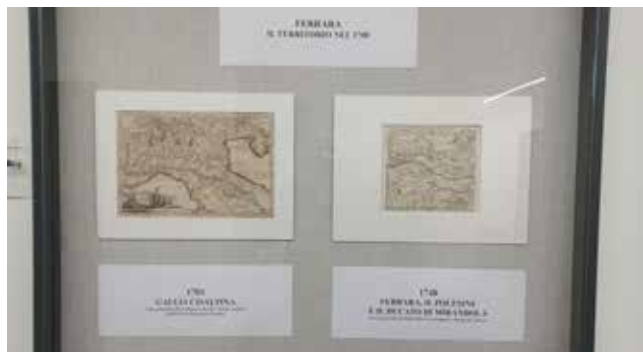
ESPOSIZIONE DOCUMENTI STORICI