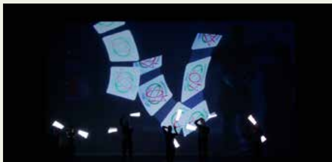
IL LOGO DEI 40 ANNI