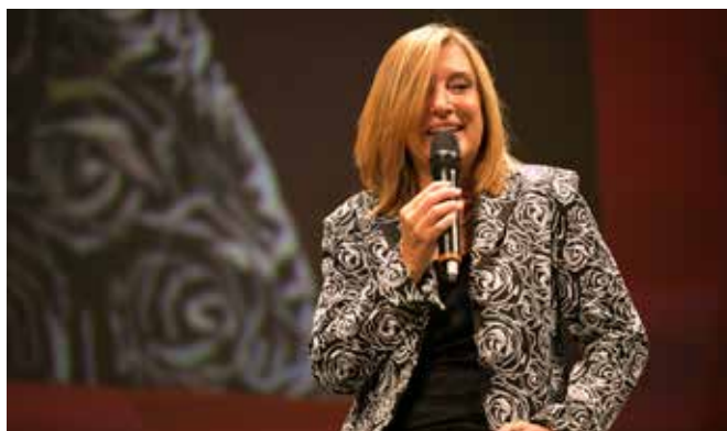
INTERVISTA ALLA PRESIDENTE GRANDI