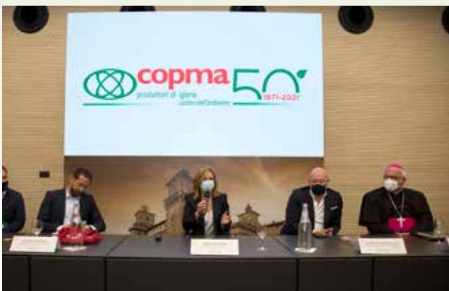
LA PRESIDENTE GRANDI APRE L'INCONTRO CON LE AUTORITÀ