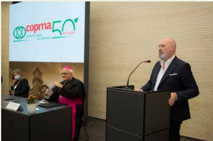
IL PRESIDENTE DELLA REGIONE STEFANO BONACCINI