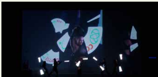
IL LOGO DEI 50 ANNI