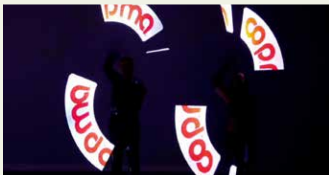
IL LOGO ORIGINALE