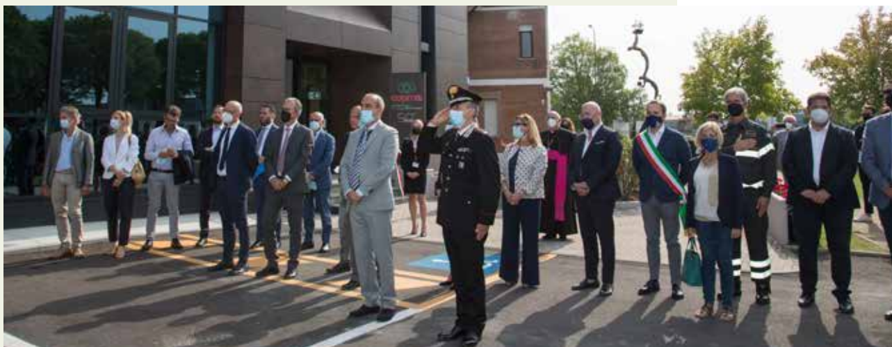
LA CERIMONIA DI INAUGURAZIONE, ALLA PRESENZA DELLE AUTORITÀ, INIZIA CON L'INNO DI MAMELI SUONATO DALLA BANDA FILARMONICA DI FERRARA LUDOVICO ARIOSTO