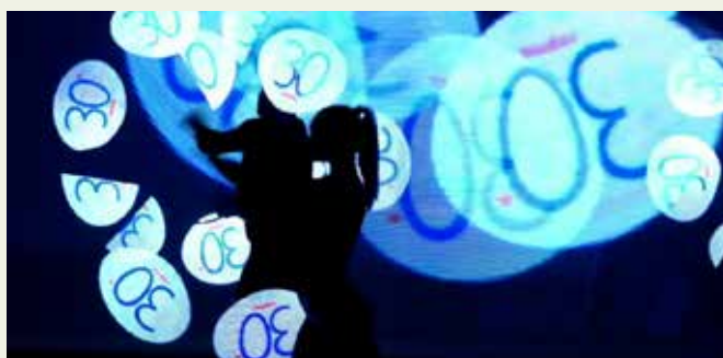
IL LOGO DEI 30 ANNI